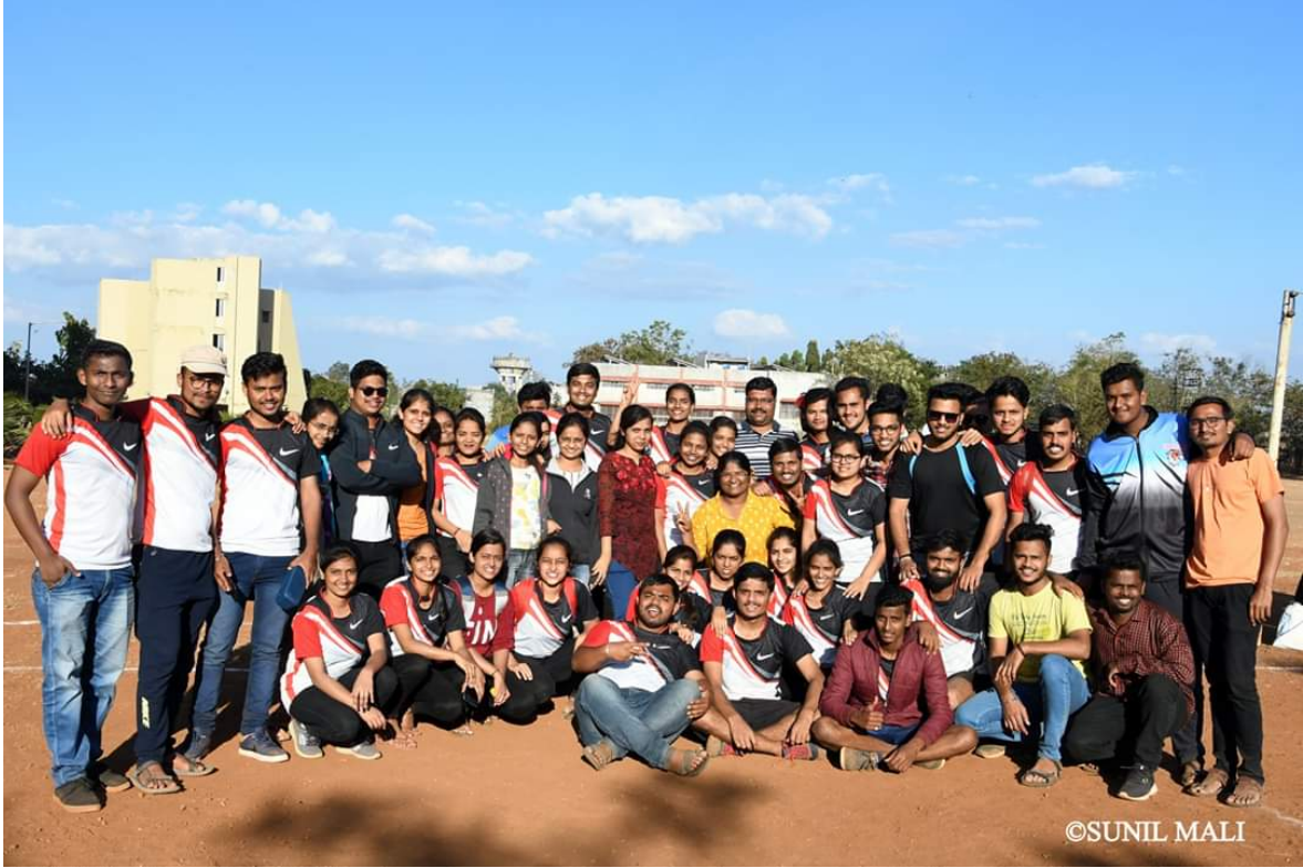
General Champions 2019-2020: Final Year B. Pharm