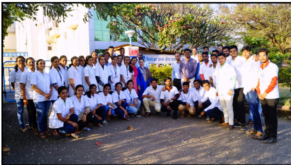
Industrial Vist of B. Pharm students to M/S Mistair Health & Hygiene Pvt. Ltd., Shirolī