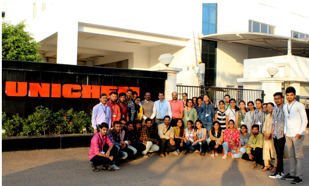
Industrial Vist of M. Pharm students to Unichem Laboratories Ltd., Goa.