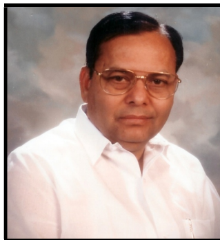
Hon'ble Dr. Patangrao Kadam Founder, Bharati Vidyapeeth, Pune